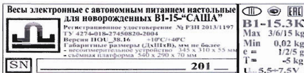
Рисунок 4 – Маркировка весов

Маркировка весов производится на фирменной планке, разрушающейся при снятии, на которой нанесено: