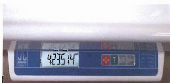
Рисунок 2 – Индикация кода юстировки

Включают весы и во время прохождения теста нажимают кнопку \ominus и, удерживая ее, нажимают кнопку \top . На индикаторе последовательно отобразятся сообщения «tEst», «USt». Нажимают кнопку \top . На индикаторе отобразится код юстировки.