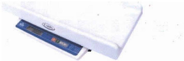
Рисунок 1 – Общий вид весов

V – тип блока индикации весов (К – жидкокристаллический, С – светодиодный);