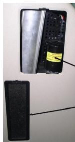
блок с фильтром тонкой очистки

2. Перед включением аппарата, проверьте входные губчатые и фильтры тонкой очистки (на дне и на боковых стенках аппарата), убедитесь в том, что они чистые, в противном случае, очистите их и поставьте обратно.