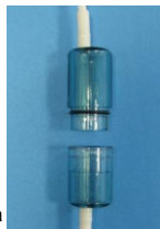
Рис. Б. Аромакапсула диффузора

Диффузор может использоваться для кислородной ароматерапии. Для этого в его устройстве предусмотрена специальная разборная аромакапсула (см. рисунок Б). При необходимости в нее можно поместить губку, пропитанную ароматической жидкостью. Это поможет сделать процедуру особенно приятной.