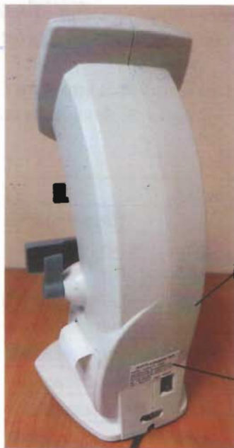
Рисунок 1 - Общий вид диоптриметра ALMAS FL-8600P и места пломбирования