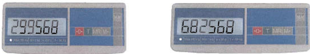
Рисунок 2 - Примеры индикация кода юстировки

Для контроля показаний счетчика (кода юстировки) включают весы и во время прохождения теста нажимают кнопку \text{0}^{\circ} и, удерживая ее, нажимают кнопку \text{T} . На индикаторе последовательно отобразятся сообщения «tEst», «CAL S». Нажимают кнопку \text{T} . На индикаторе отобразится код юстировки.